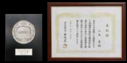
درع وشهادة جائزة العاملين الماهرين المميزين