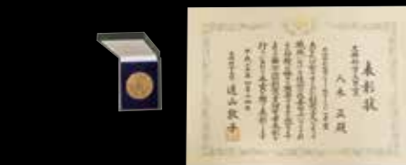
ميدالية وشهادة حصل عليهما مع جائزة وزير التعليم والثقافة والرياضة والعلوم والتكنولوجيا